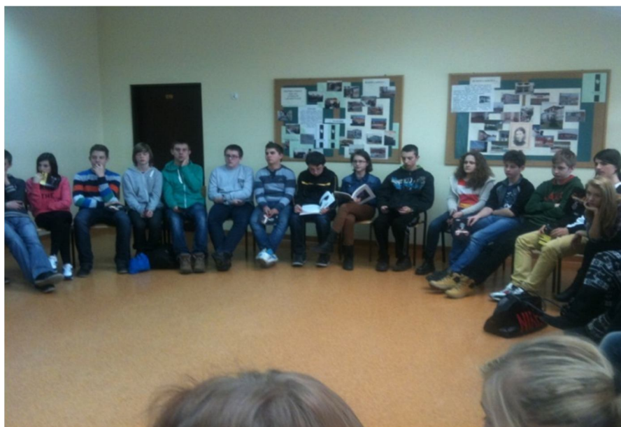
Uczniowie Gimnazjum w Kramsku w czasie spotkania dotyczącego działalności Amnesty International

Struktura programu opracowanego przez ORE realizuje założenia nowego modelu doskonalenia i wspierania szkół, którego najważniejszym elementem jest zespołowe uczenie się nauczycieli. W programie bowiem uczestniczy cała Rada Pedagogiczna, wspierana przez eksperta, który towarzyszy jej od etapu diagnozy aż do ewaluacji.