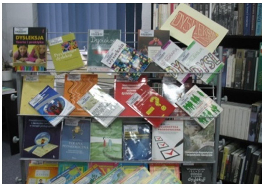
Ekspozycja książek dotyczących dysleksji

Warsztaty trwały dwie godziny. Wszyscy uczestnicy otrzymali zestawienie bibliograficzne pt. „Dysleksja. Jak pracować z dzieckiem z grupy ryzyka dysleksji” – wybór literatury dostępnej w Bibliotece Pedagogicznej w Słupcy. Zajęcia były również okazją do obejrzenia przygotowanej ekspozycji książek związanej tematycznie z warsztatami.