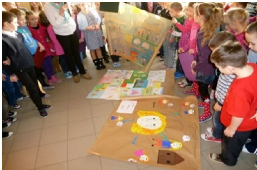
Uczniowie ze Szkoły Podstawowej nr 11 w Koninie

Roczny cykl pracy to pięć spotkań szkoleniowych z Radą Pedagogiczną i realizacja czterech zadań projektowych w zależności od zdiagnozowanego poziomu kompetencji całej Rady. Zadania, które nauczyciele wykonują we współpracy z uczniami i społecznością lokalną, odzwierciedlają wymagania stawiane szkołom w rozporządzeniu o nadzorze pedagogicznym i podstawie programowej. Są propozycją pracy wychowawczej, pomagają nauczycielom w kształtowaniu u młodych ludzi umiejętności życia i działania w zmieniającym się otoczeniu, w przygotowaniu uczniów do aktywnego uczestniczenia w życiu społecznym.