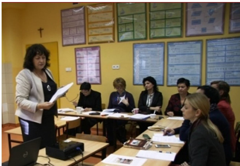
Nauczyciele ze Szkoły Podstawowej w Radolinie w trakcie szkolenia

Program wpisuje się w działania związane z realizacją postanowień Karty Edukacji Obywatelskiej i Edukacji o Prawach Człowieka Rady Europy. W myśl zapisów zawartych w Karcie wszyscy nauczyciele, bez względu na staż pracy, nauczany przedmiot powinni nauczać w demokracji . Jego celem jest rozwój społecznych i obywatelskich kompetencji rad pedagogicznych, stworzenie demokratycznej kultury szkoły poprzez budowanie kompetencji zespołowych oraz wprowadzanie nauczania opartego na uczestnictwie wszystkich osób zaangażowanych w proces edukacyjny.