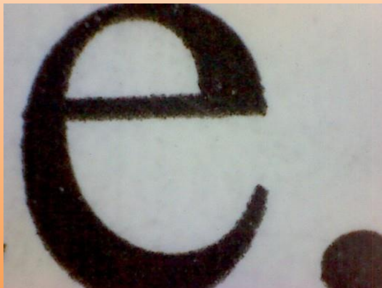
Druk magazynowy na gładkim papierze