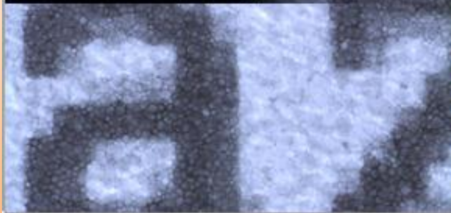
Electronic ink display magnified