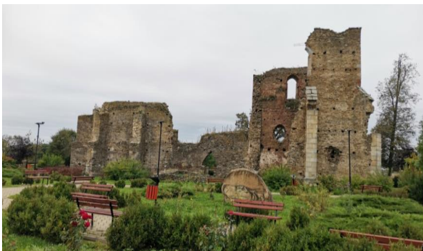
Ruiny katedry katolickiej w Baia

Śladów Polaków na ziemiach obecnej Rumunii można doszukiwać się już w okresie średniowiecznym. Za pierwszą ze znanych Polek, można uznać księżniczkę Małgorzatę , która była żoną hospodara mołdawskiego Aleksandra Dobrego. Ożenił się on z nią około roku 1393 lub 1394. Ponieważ była wyznania rzymskokatolickiego ufundował dla niej katedrę w Baia, która była pierwszą stolicą Mołdawii. Świątynia ta nosiła wezwanie św. Dziewicy i była największym kościołem rzymskokatolickimi na terenie Mołdawii. Jeden z architektów miał twierdzić, że była gestem dyplomatycznym wobec silnych, ale zarazem agresywnych sąsiadów, jakimi mieli być w tym czasie Polacy.