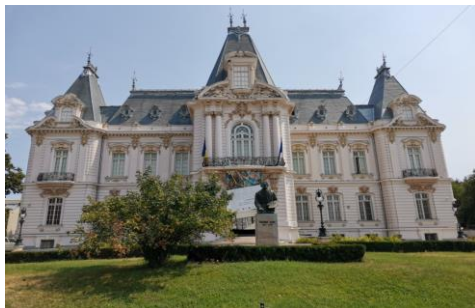
Miejsce internowania Prezydenta Ignacego Mościckiego w Craiovie