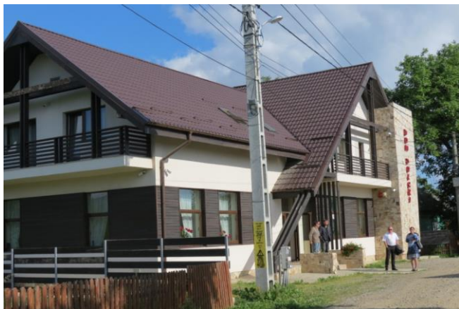
Dom Polski na Pleszy

Okres I wojny światowej nie był tragiczny w dziejach wioski w przeciwieństwie do działań wojennych w latach 1940-1944. W 1943 r. Pleszanie byli werbowani do armii rumuńskiej, choć trudno określić ilu mężczyzn wcielono wojska. Trafili oni do 14 dywizji, która przez Odessę została przewieziona pod Stalingrad i tam walczyła przy boku Niemiec z sowietami. W roku 1944 Plesza znalazła się na linii frontu pomiędzy wycofującymi się Niemcami, a nacierającą armią czerwoną. Mieszkańcy ukrywali się w lasach, a nocą wracali do domów, żeby zabrać co cenniejsze rzeczy.