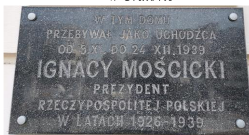
Tablica upamiętniająca internowanie Prezydenta Mościckiego w Craiovie

Na terenie Rumunii zatrzymany został również prezydent Ignacy Mościcki . Miejsca, w których był internowany to między innymi Bicz oraz Craiova. Udało mu się jednakże wyjechać do Szwajcarii. Było to już 25 grudnia 1939 r. Inni spróbowali uciec i to z pozytywnym skutkiem. Tak było w przypadku Edwarda Śmigłego Rydza, Felicjana Sławoja Składkowskiego, Witolda Grabowskiego, Mariana Zyndrama-Kościałkowskiego, Juliusza Poniatowskiego czy Mchała Grażyńskiego.