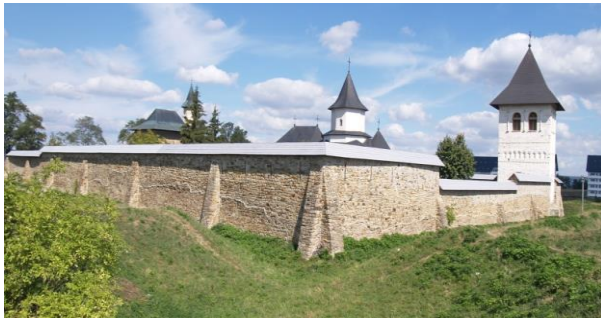
Monastyr Zamca (Suczawa) – miejsce stacjonowania Jana III Sobieskiego

pochodzić od polskiego słowa „zamek”. Warto dodać, że Sobieski zamierzał usadowić na tronie Mołdawskim swojego syna Jakuba. Wojska polskie pozostawały w tym monasterze przez kilka lat.