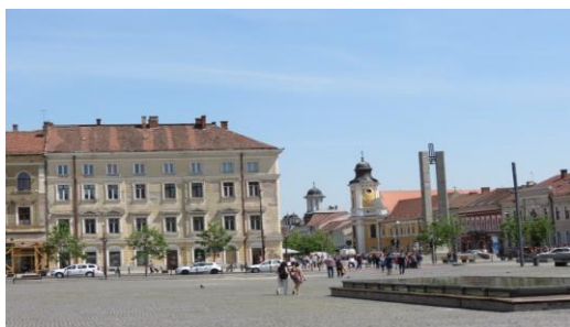
Dom w Cluj-Napoca gdzie mieszkał Józef Bem

Pozostańmy jeszcze w Siedmiogrodzie. Tu, jedną z kluczowych postaci polskich związanych z tym regionem jest z pewnością generał Józef Bem . Ten polski generał urodził się 14 marca 1794 r. w Tarnowie (podaje się również jako miejsce urodzenia Busko pod Tarnowem). W czasie powstania listopadowego był dowódcą artylerii. Potem aktywnym działaczem Wielkiej Emigracji. Między innymi założył dwie organizacje. Pierwszą z nich było Towarzystwo Historyczno-Literackie a drugą Towarzystwo Politechniczne Polskie z siedzibą w Paryżu. Brał udział w Wiośnie Ludów, a w latach 1848-1849 był naczelnym wodzem powstania węgierskiego. W czasie walk przeciwko Austriakom zdobył między innymi Sybin i Braszów. Wkroczył również na Bukowinę. Potem stał się wysokim dowódcą wojsk osmańskich. Zmarł 10 grudnia 1850 r. w Aleppo (obecnie Syria). Na jednej z kamienic w Cluj-Napoca (tzw. Klużu) znajduje się tablica informująca o pobycie w niej generała Józefa Bema.