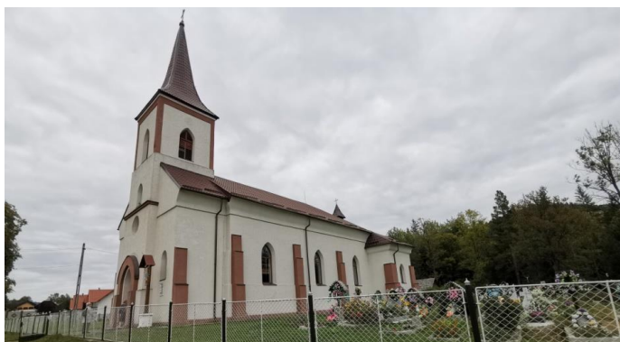
Kościół w Pojanie Micului