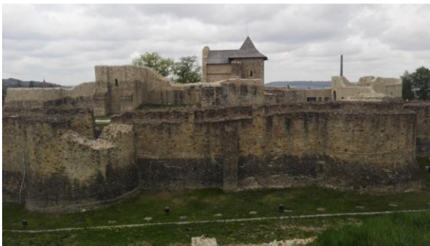
Twierdza w Suczawie, którą próbował zdobyć Jan I Olbracht

Niestety oblężenie Suczawy nie powiodło się, a wyprawa 40 tysięcznej armii pospolitego ruszenia zakończyła się wielkimi stratami polskich wojsk w bitwie pod Koźminem . Straty były tak dotkliwe, że od tego czasu klęskę tę na wieki utrwaliło mocno przesadzone powiedzenie: Za króla Olbrachta wyginęła szlachta .