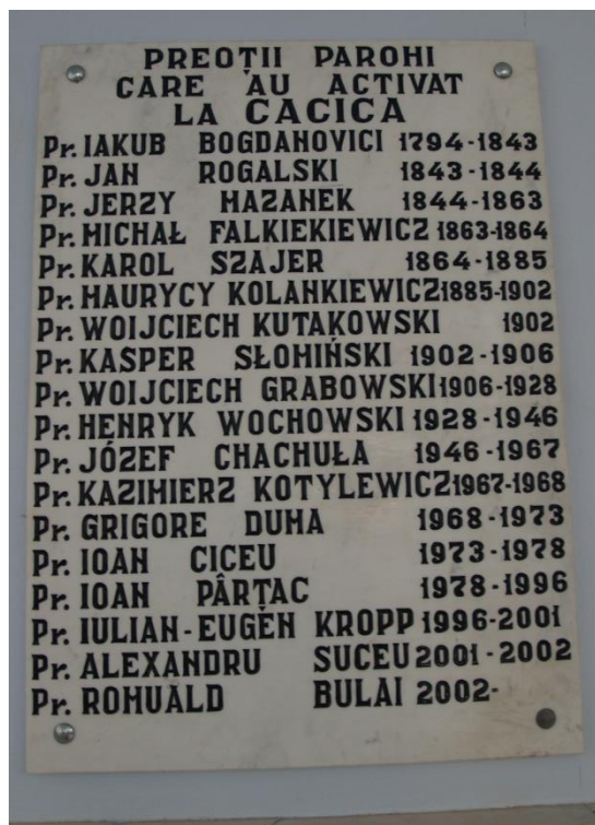
Tablica z nazwiskami polskich duchownych – proboszczów parafii w Kaczyce